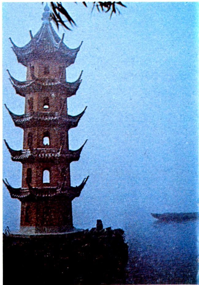
蘇州湖邊的磚塔11-13世紀

後分南北派，慧能是南派始祖，他說：「菩提本無樹，明鏡亦非台，本來無一物，何處惹塵埃。」故主張頓悟。而北派始祖是神秀，他曾說：「身為菩提樹，心如明鏡台，時時勤拂拭，免使惹塵埃。」故主張漸悟。佛教的分宗，到後期只剩下淨土宗及禪二宗流傳最廣。其實分宗只是對佛理不同看法而已，雖然修行方法有不同，但歸根究